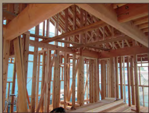
K様邸、圧倒的な木の量と、すべて無垢材