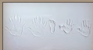
ご家族の記念手形、どこにあるか お探してください！