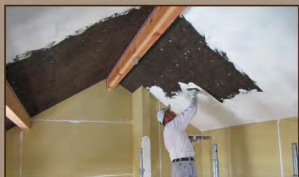
断熱材は火災時に有毒ガスを出さない炭化コルク