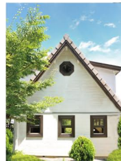
正倉院式ログの家(アリス))