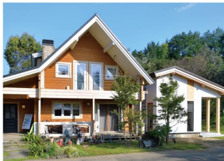
築20年のログハウス