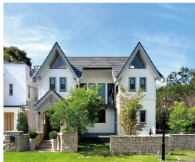
クラシックモダン(ノーブル)