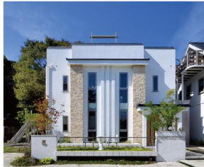
子育て世代の家(ルルカ)