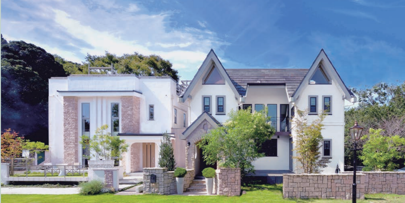
無添加住宅 ルル家：33坪（左）

漆喰の空間に無垢の木そしてフローリング。漆喰も調色で一面だけ色を変えるのも、楽しい部屋になる。