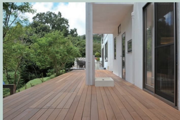
無添加住宅 つながるキッチン：19畳（下）

もくもく村の自然に包まれていると、その中に身を置くだけで癒しを得られることを実感しています。自然の持つ計りしれないエネルギーをあらゆる方法で家づくりに取り入れ何よりも「ご家族の健康と幸せに貢献する家づくり」を目指しています。