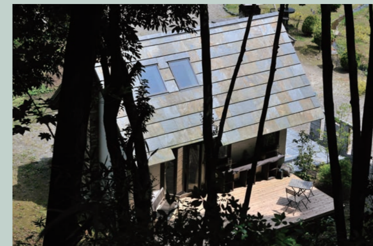
無添加住宅:7.24坪 男の隠れ家がコンセプト