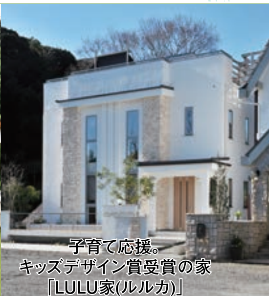
子育て応援。 キッズデザイン賞受賞の家 「LULU家(ルルカ)」