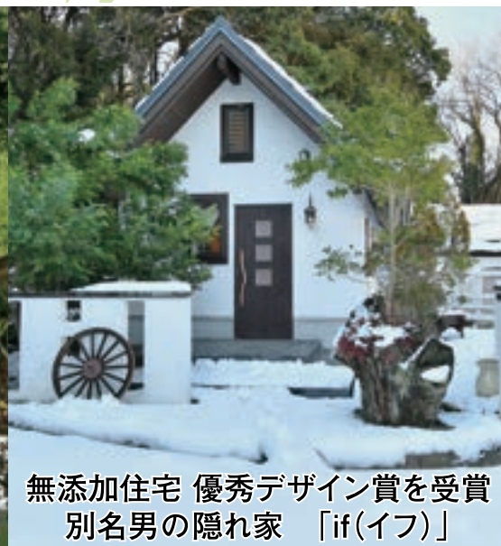
無添加住宅 優秀デザイン賞を受賞 別名男の隠れ家 「if(イフ)」