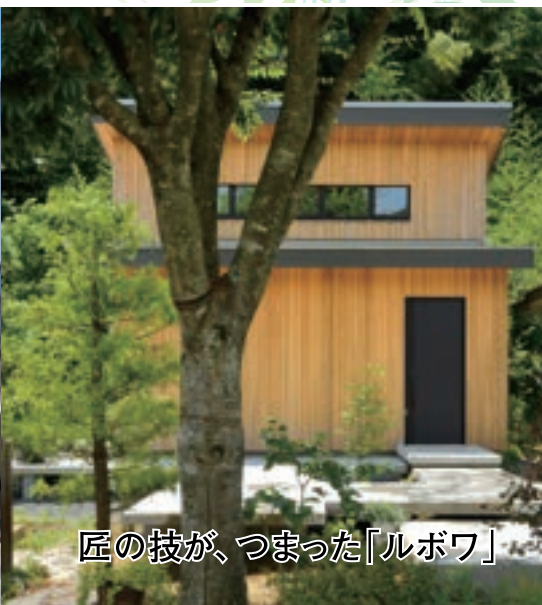
匠の技が、つまった「ルボワ」