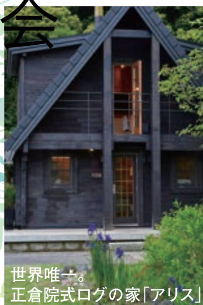
世界唯一。 正倉院式ログの家「アリス」