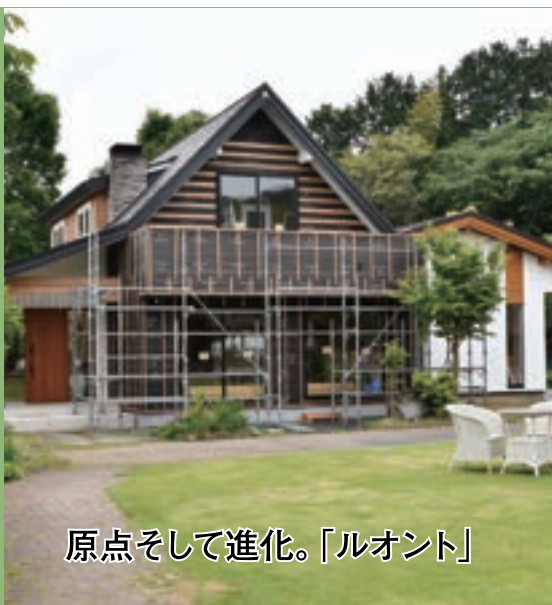
原点そして進化。「ルオント」