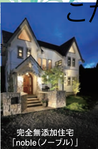
完全無添加住宅 「noble(ノーブル)」